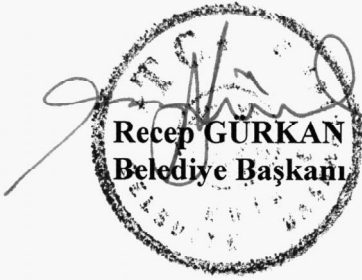
Recep GURKAN Belediye Başkanı

İşaretle yapılan oylama sonucunda; 5393 sayılı Belediye Kanununun 41. maddesi gereğince; stratejik planlarımıza uygun olarak hazırlanan 2016 Yılı Belediyemiz Performans Programının geldiği şekilde aynen kabul ve tasdikine oybirliği ile karar verilmiştir.